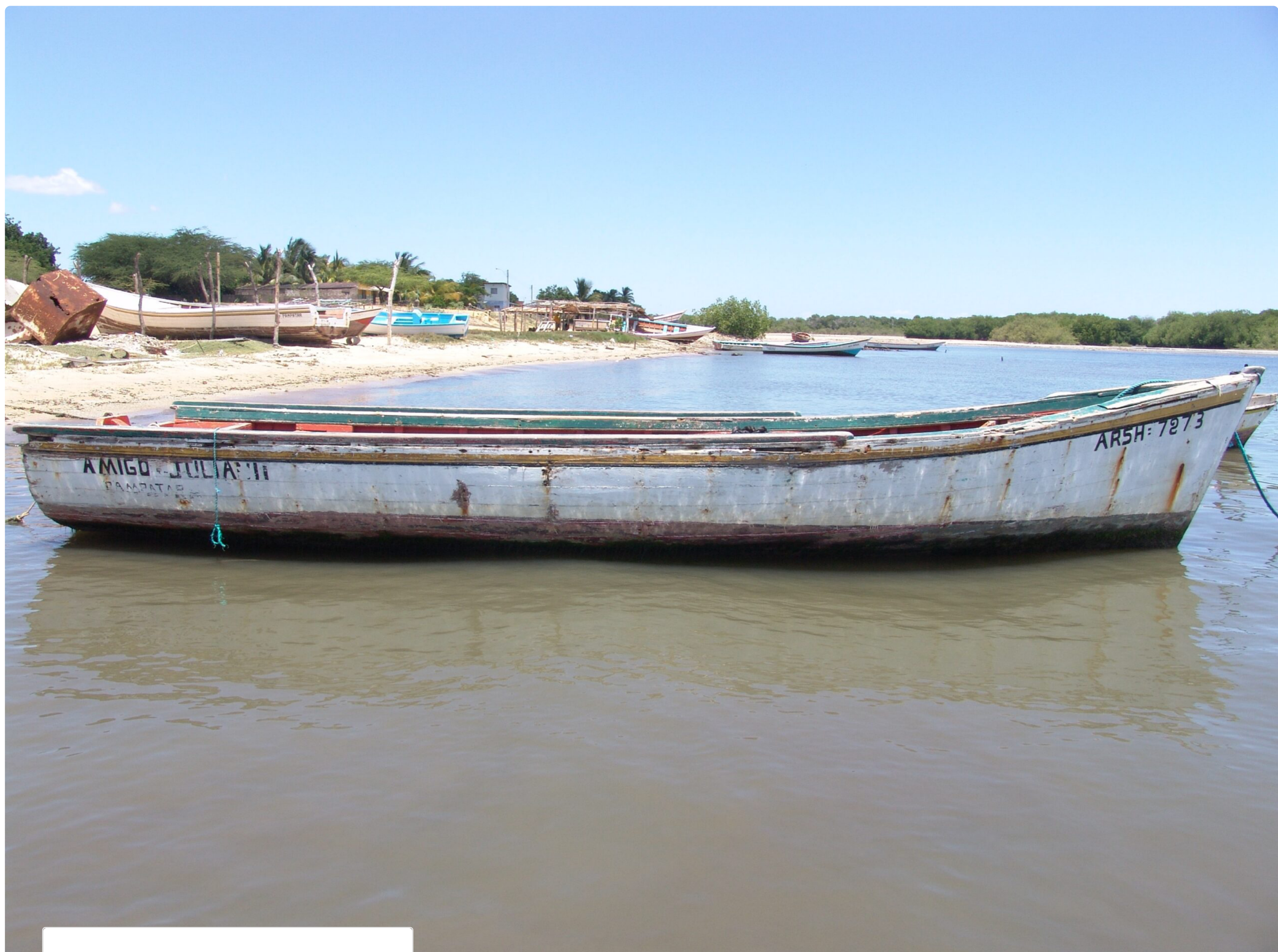
Luis Molina-Pantin Los Peñeros, 2009 Color print 38 x 50 cm edit of 7