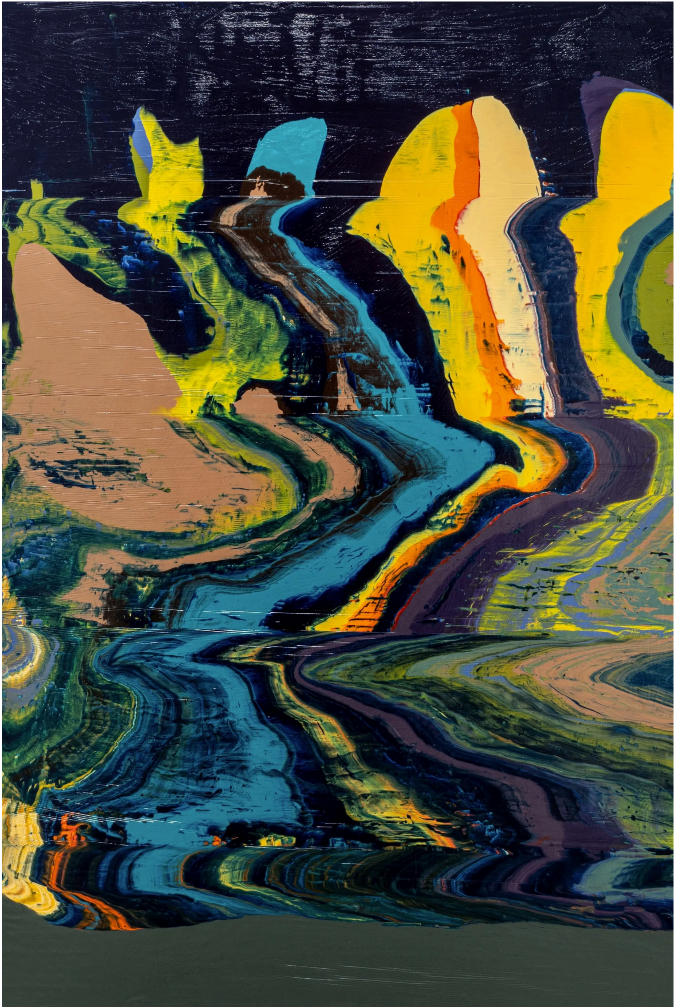
José Yaque. Sodalita con impurezas.